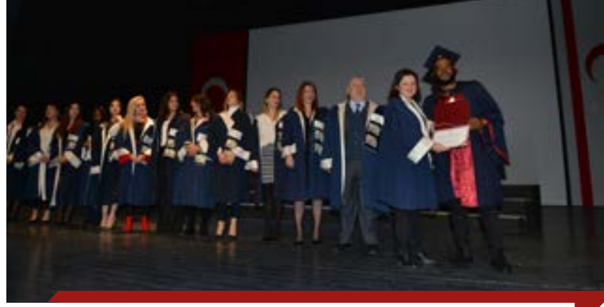
Yakın Doğu Üniversitesi Fen-Edebiyat Fakültesi'nden 2018-2019 Akademik güz döneminde mezun olan öğrenciler, Yakın Doğu Üniversitesi Atatürk Kültür ve Kongre Merkezi'nde gerçekleştirilen mezuniyet töreni ile diplomalarını aldı.